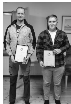
...och i brons.