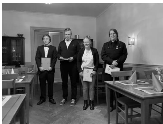
Mottagare av förtjänsttecknet i silver...