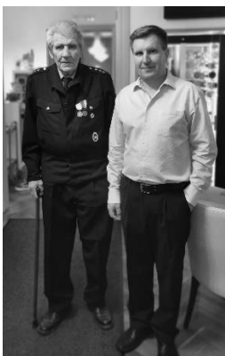
Hederskårschef och kårchef.